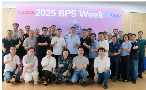
博世精益生产体系学习周