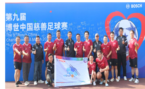
博世中国慈善足球赛