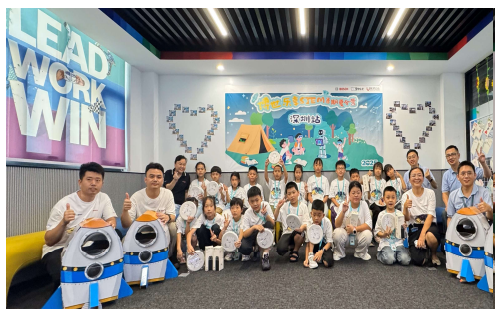
博世乐享STEM暑期夏令营活动