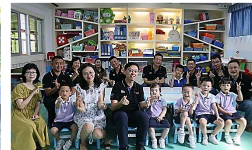
走访慰问龙岗福利院中心